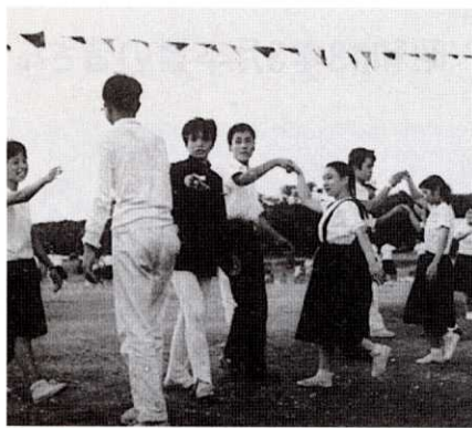
▲懐かしの体育祭でのフォークダンス

卒業してから45年経ちました。3年前に久し振りにクラス会が開かれました時は、お食事も余り取らず、皆さんお話を夢中になっておりました。今回、4人で計画しております。11月に予定しております。多数の出席を楽しみにしております。