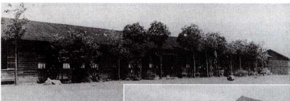
旧校舎から新校舎へ (昭和32年8月に移転)

相変わらずの毎日を送っておりますが、ウォーキングを毎日1時間と決めて半年ほど前から続けています。