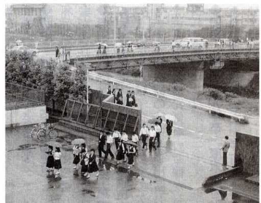
▲校門が浅川側に付け変わった