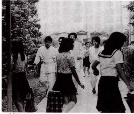
▲制服が廃止になった頃の校内で